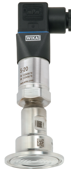
Система мембранного разделителя, модель DSS22T

Модель DSS22T особенно хорошо подходит для работы с газами, сжатым воздухом и паром, а также жидкими, вязкими, сыпучими и кристаллизующимися средами. Прибор предназначен в первую очередь для использования в промышленности.